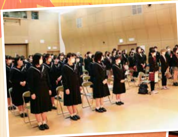
福岡美容専門学校 福岡校、 折尾愛真高等学校 商業科 美容専科コース

職員一同、全力を尽くし指導にあたってまいり ます。通信生をかかえるサロン様におきましては ご理解とご協力をいただきますようお願い申し 上げます。