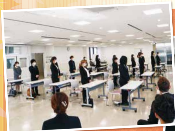
福岡美容専門学校 北九州校